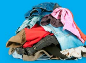
INDUMENTI E SCARPE USATE