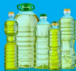
OLI ESAUSTI DA CUCINA