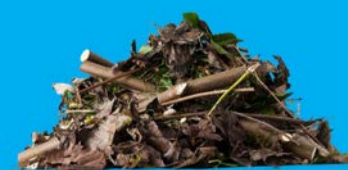
SFALCI E POTATURE